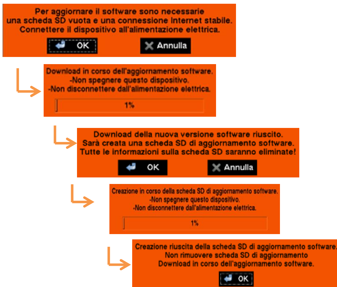
Figura 2: Scaricare l'aggiornamento software tramite LAN/WLAN

A seconda dell'apparecchio, è necessario disporre di una scheda SD (plusoptix A12C / A12R) o di una chiavetta USB (plusoptix A16) vuote. I seguenti messaggi di stato sono gli stessi per il modello plusoptix A12C e A16 e differiscono soltanto per il supporto di archiviazione.