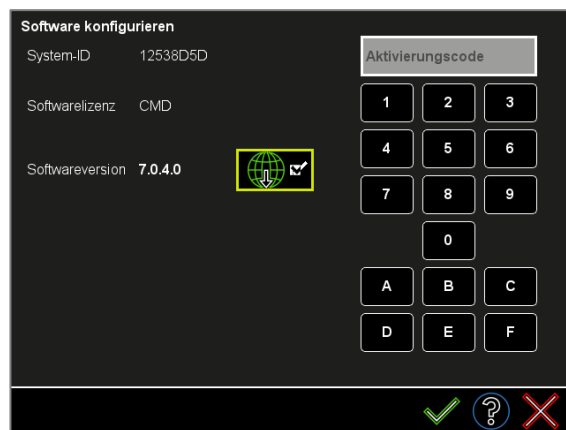
Abbildung 1: Software-Updates herunterladen