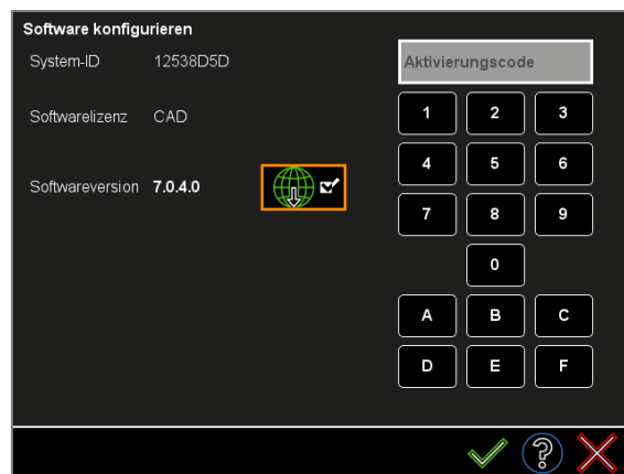
Abbildung 1: Software-Updates herunterladen