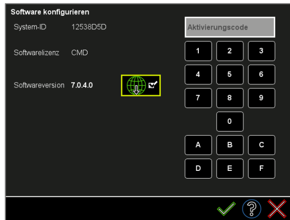
Abbildung 1: Software-Updates herunterladen